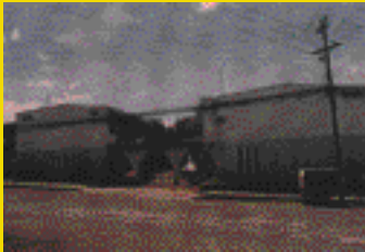
Sabanilla Montes de Oca 6 Condos with private parking and room to build two more. Apt. for sale very good area and very good prices. Ileana Reyes 373-1368