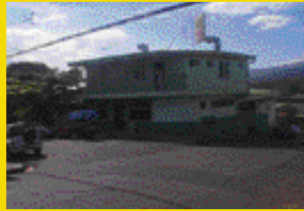
Grecia de Alajuela Cerca del estadio Rene Méndez 397-3707