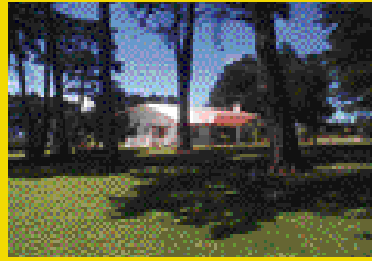
Los Ángeles de San Rafael de Heredia BARGAIN guard house, main house just remodel amazing views of the valley. Michelle C.Cedeno. 262-7373