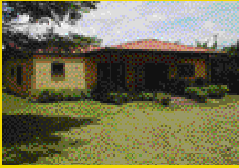
Río Segundo de Alajuela Bargain Yalile Rosales 383-3328