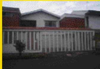
Curridabat GANGA muy buen precio. Ileana Reyes 373-1368