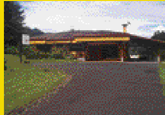
San Rafael de Heredia Luxury home for sale. Tranquility, fresh air. Ileana Reyes 373-1368