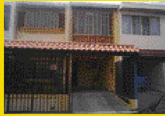
Los Lagos de Heredia Amazing price to a very nice house Yalile Rosales 383-3328