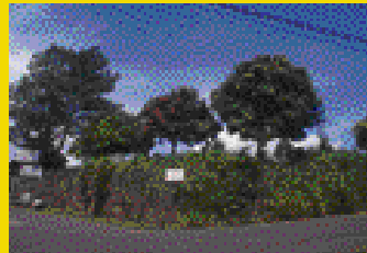
La Uruca Comercial / Industrial LOT for sale Rene Méndez 397-3707