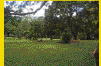
Alajuela Río Segundo Quinta for sale amazing views of the Valley. Michelle C.Cedeno. 262-7373