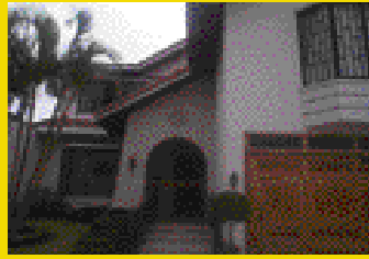
Rohrmoser by the AID Beautiful house for sale. Yalile Rosales 383-3328