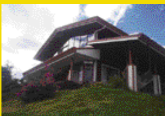
Grecia Con las mejores vistas Marina Obando 361-3137